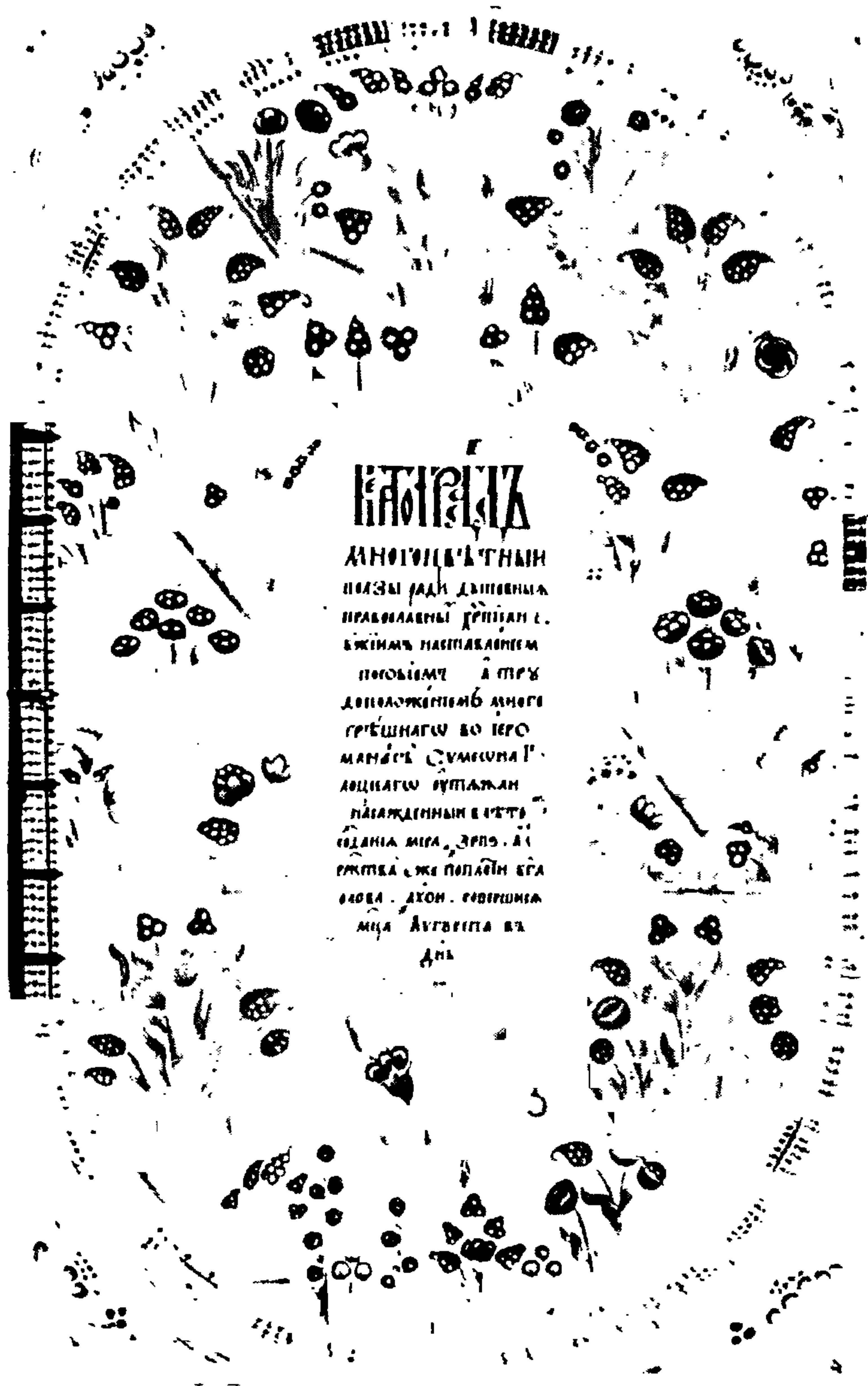
Список С "Вертограда многоцветного" (БАН, шифр: П I А 54), титульный лист.